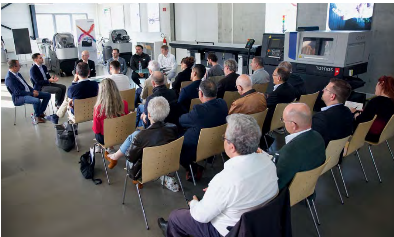
Tavola rotonda organizzata da Tornos durante le giornate stampa AFDT