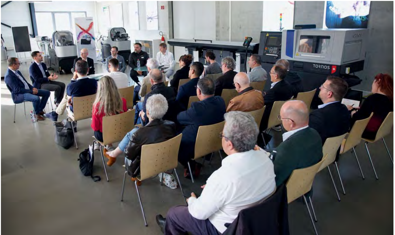
Mesa redonda organizada en Tornos durante las jornadas de prensa de la AFDT