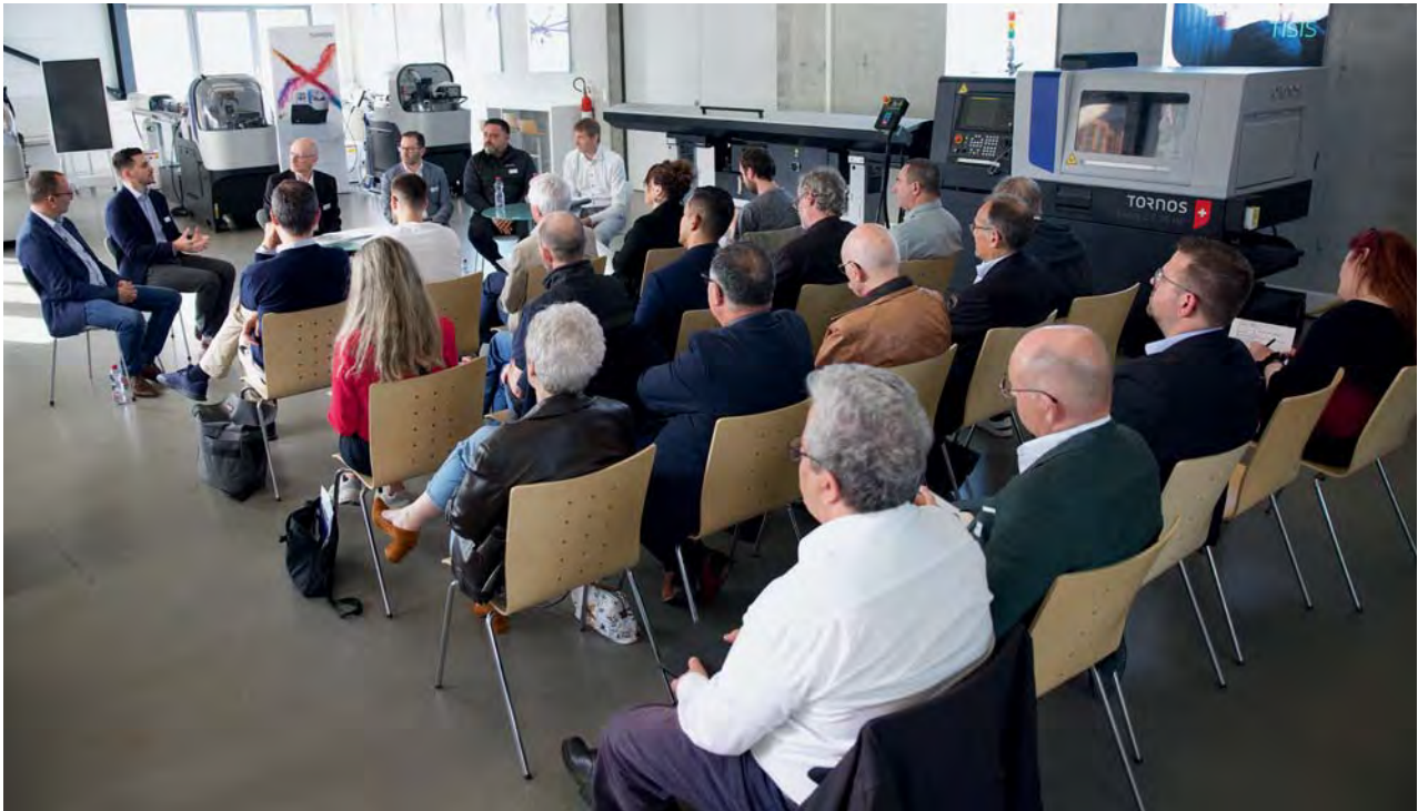
Roundtable-Gespräch bei Tornos während der AFDT-Pressetage.